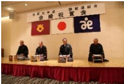
喜多流高田の皆様