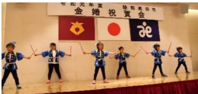
下矢作保育園の皆さん