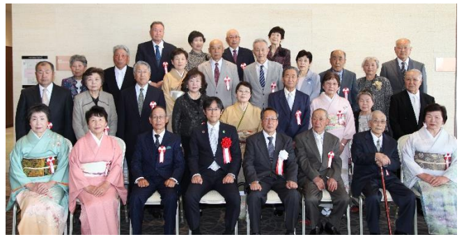
5/14 集合写真② (高田町)