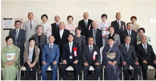
5/14 集合写真① (矢作町・横田町・竹駒町・気仙町)