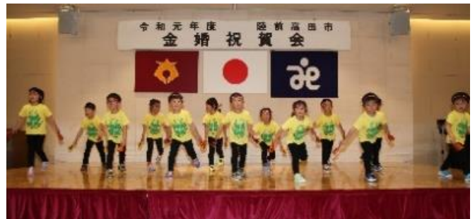
広田保育所の皆さん