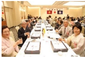
5/14 会場内の様子 (乾杯、高田音頭)