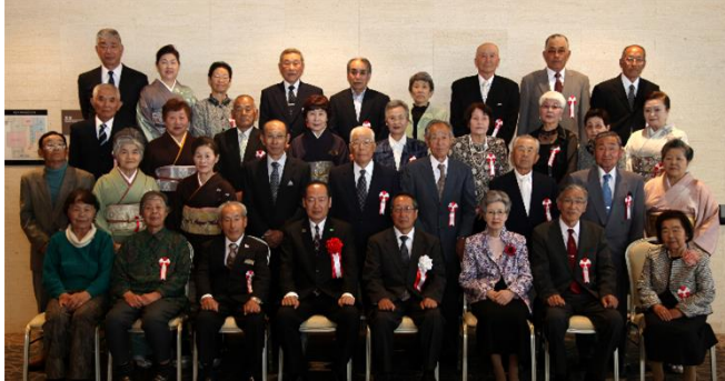
5/21 集合写真③ (米崎町・小友町・広田町)