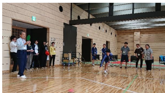
カーリンコン会場の様子

今年度で20回目の参加となった陸前高田市。今回の参加率は59.7%で、対戦相手の鹿児島県南さつま市(参加率70.3%)に勝つことはできませんでしたが、カーリンコンの会場では、会員の方も一般の方も、一緒に楽しんでいる様子でした。