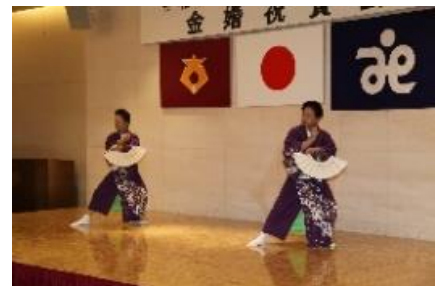
新日本舞踊会の皆様