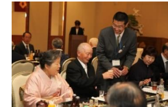
5/21 会場内の様子 (歓談、アトラクション鑑賞)