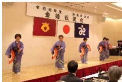
高田民踊会の皆様